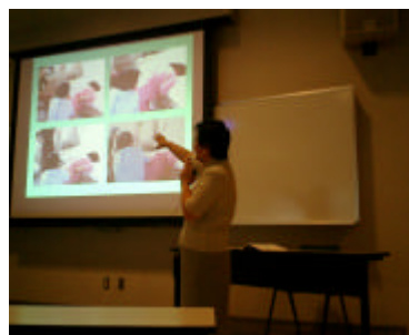
ワークショップ 3 「母性看護学研究と質的研究方法論」