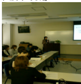
ワークショップ 2 「周産期における電子カルテ」

母性看護に活用されている電子カルテの最先端のお話が聞けて、当院で将来的に導入される電子カルテ化の期待も広がり多くの刺激を受けたワークショップでした。